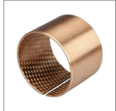
内外倒角 ID and OD chamfers